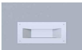
Poignée cuvette en acier inox