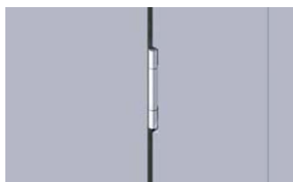
Paumelles réglables 3D en acier inox