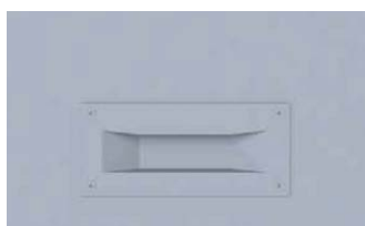
Poignée cuvette thermolaquée